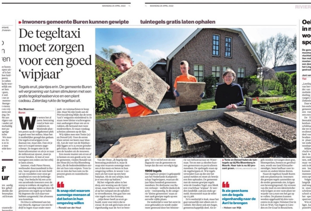
Afbeelding 2. Krantenartikel over het NK tegelwippen in gemeente Buren

De komende jaren haken we aan bij campagnes zoals Groene Gezonde Bedrijventerreinen, Gezonde Bodem en het Vergeten Plantseizoen. Het is niet mogelijk om de campagnes nu al vast te leggen, omdat het qua publiciteit en ondersteuning goed is om aan te sluiten bij landelijke acties. Wel reserveren wij in totaal €10.000 per jaar voor Steenbreek en de acties vanuit het bestaande budget klimaatadaptatie.