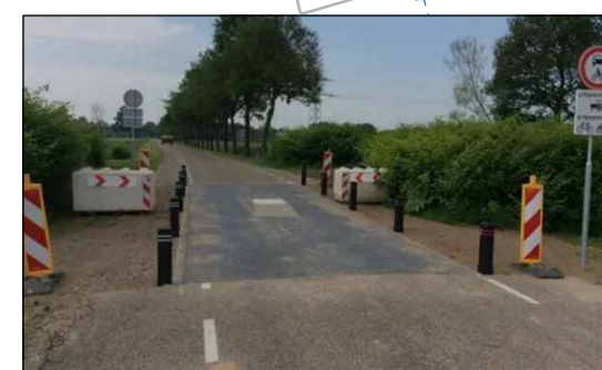
Toepassen landbouwsluit in Achterstraat